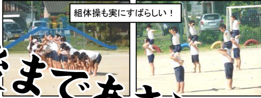
組体操も実にすばらしい！