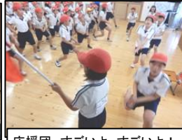
応援団、すごいよ、すごいよ！