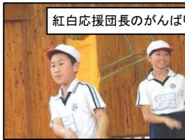
紅白応援団長のがんばりがすばらしい！