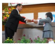
とても立派な態度でした！